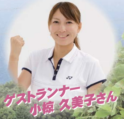
ゲストランナー 小椋 久美子さん